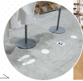
レジ前の床には、間隔を空けて並ぶように表示されています。

今回は、感染対策に役立つ商品や、お家での時間を楽しむ情報を教えていただきました。