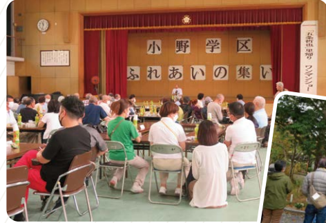
地域での 交流事業