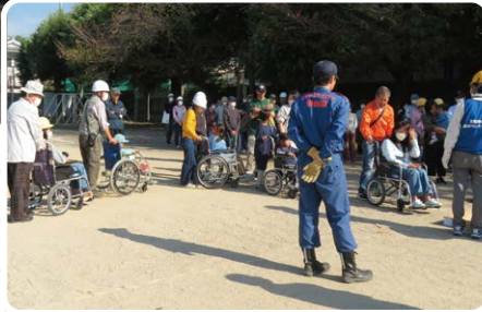
災害時要配慮者 支援訓練