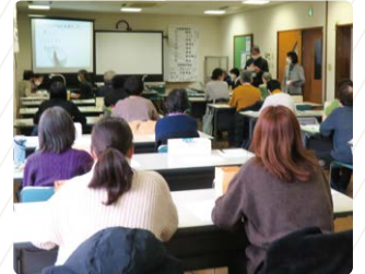
要約筆記ボランティア入門講座

ちいき ふくしかつどう 地域で福祉活動をすすめる がつくしゃかいふくしきょうぎかい 学区社会福祉協議会の支援