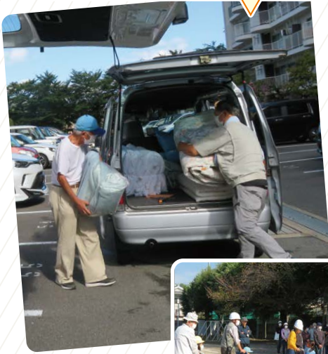
寝具 クリーニング サービス