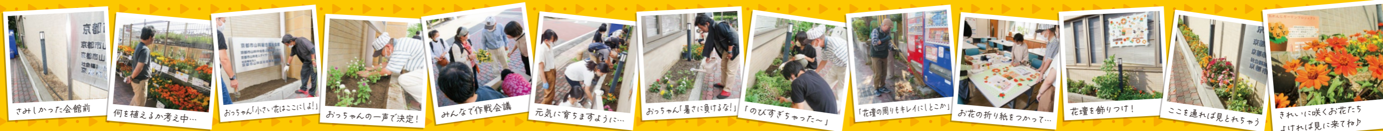
さみしかった会館前