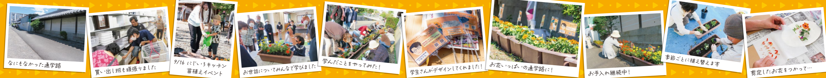
なにもなかった通学路